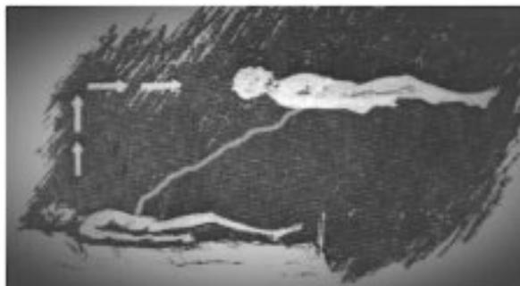
Rota do Psicossoma