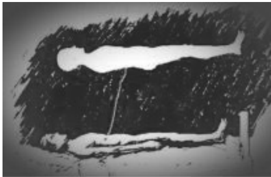
Psicossoma se projetando

ACONTECE TODAS AS NOITES PARA TODAS AS PESSOAS QUE DORMEM