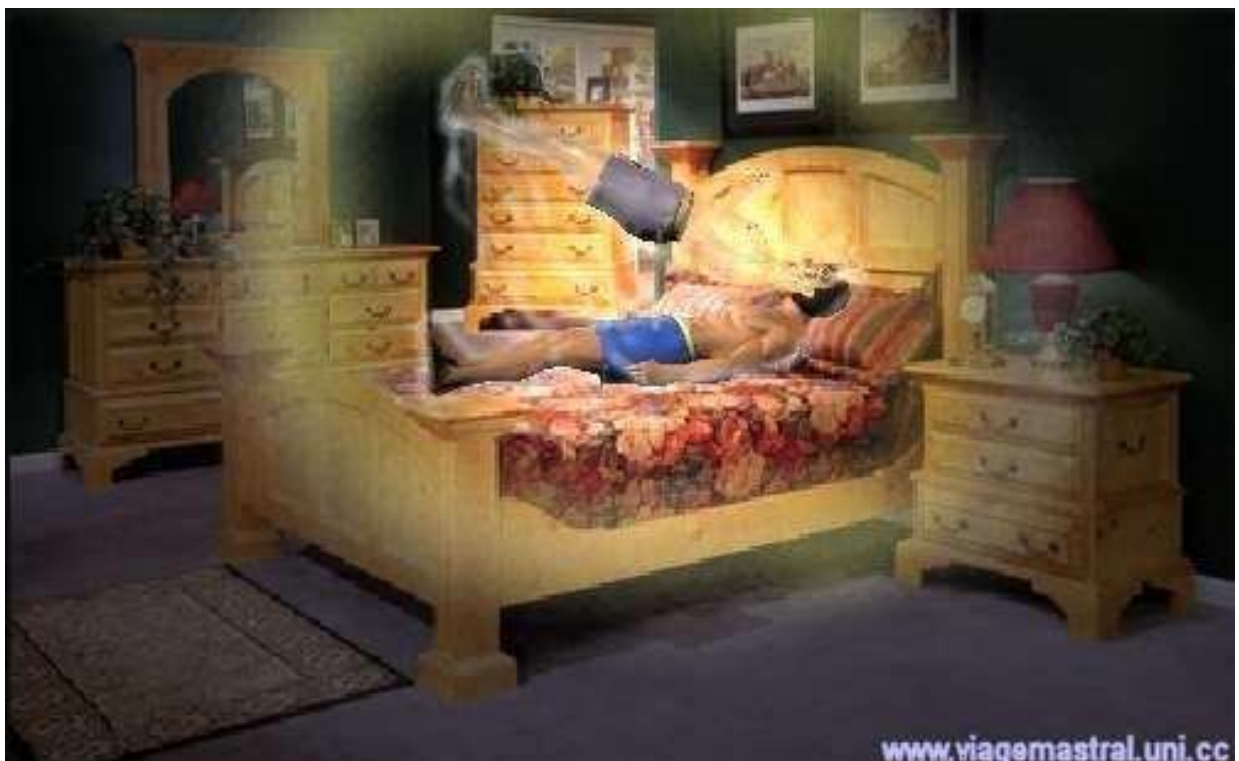
Saída Parcial do Corpo conhecida como Trendelemburg Extrafísico